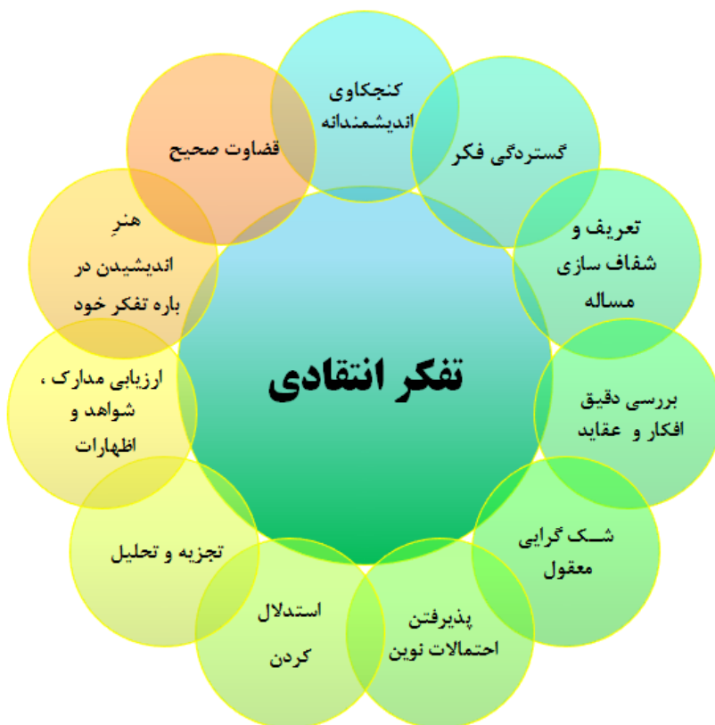
شکل ۱: مؤلفه‌های یازده گانه تفکر انتقادی بر اساس مبانی نظری پژوهش

در رابطه با جایگاه تفکر انتقادی در کتاب درسی تاریخ معاصر ایران در مقطع متوسطه، تحقیق و یا پژوهشی که به‌طور مستقیم به این موضوع پرداخته باشد، یافت نشد اما در عین حال تحقیقات مختلفی درباره‌ی جایگاه تفکر انتقادی در درس، پایه‌ها و مقاطع دیگر انجام شده که در اینجا به برخی از آنها اشاره می‌شود: